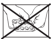
Abbildung 2: Lösen Sie einen einzelnen Blister mit einer Tablette darin durch vorsichtiges Reißen entlang der Perforation aus dem Blister-Streifen.

Abbildung 1: Drücken Sie Ihre Tablette nicht durch die Folie, da die Tablette dadurch beschädigt werden kann.